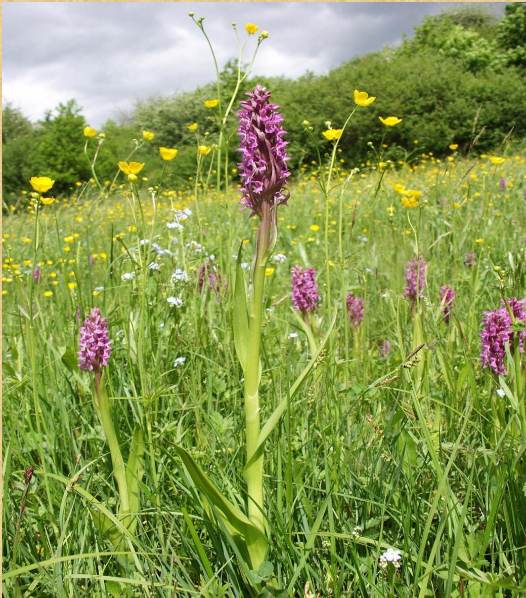
Raudonoji gegunė ( Dactylorhiza incarnata )