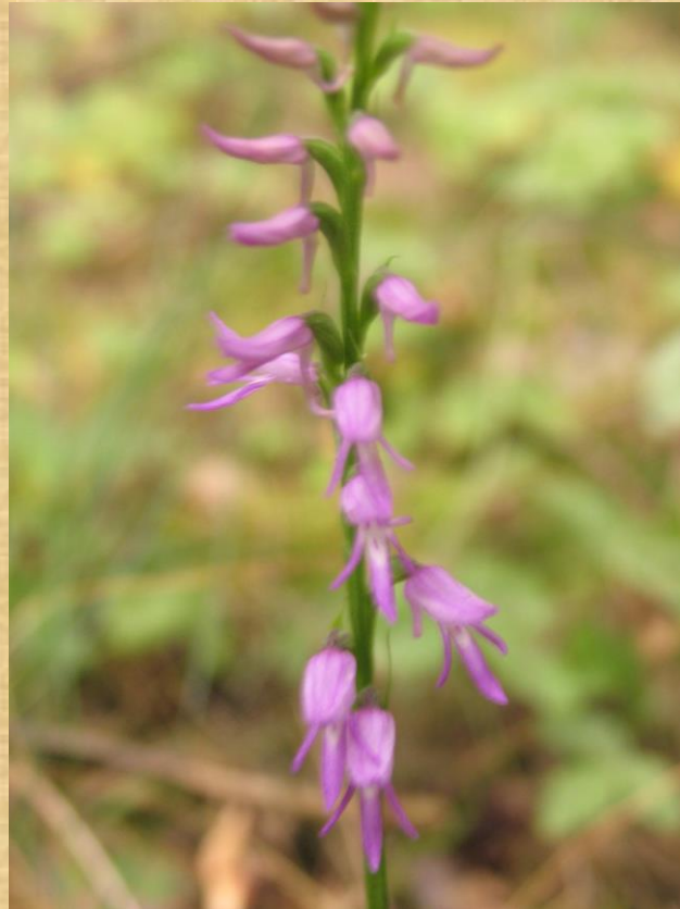
Miškinė plikaplaiskė ( Neottianthe cuculata )