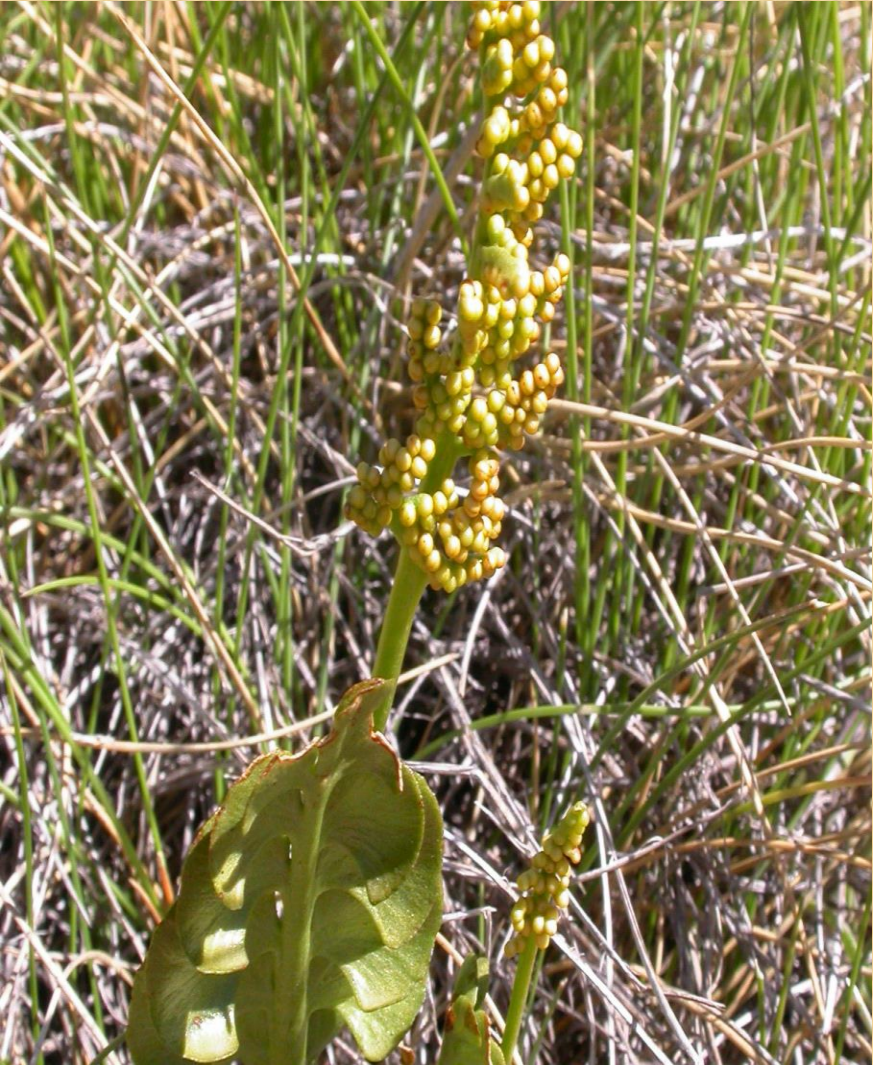
Daugiaskiltis varpenis ( Botrychium multifidum )