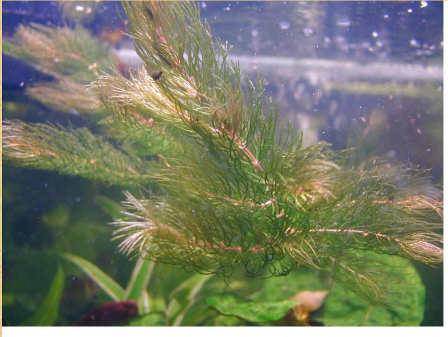
Gležnalapė nertis ( Ceratophyllum submersum )